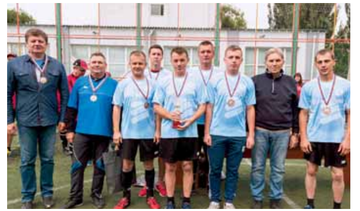
Команда «Локомотив» (Тольяттинский РТК) - 3 место