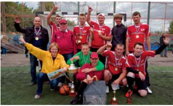
Команда «Самарка» (Самарский РТК) - 1 место