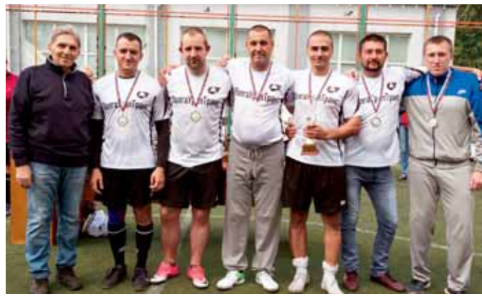
Команда «Офис» (Дирекция) - 2 место